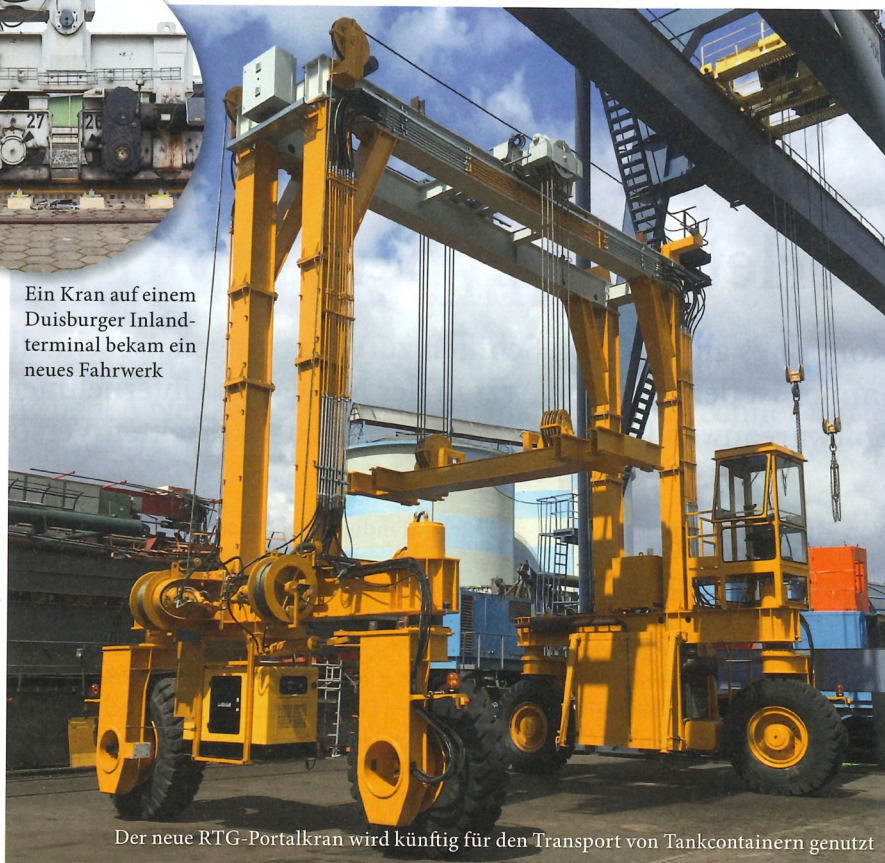
Der neue RTG-Portalkran wird künftig für den Transport von Tankcontainern genutzt